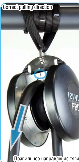
Правильное направление тяги